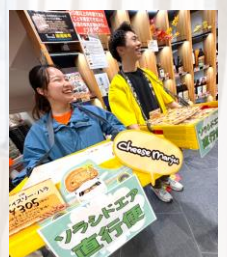
ソラシドエア直行便で納品されたチーズ饅頭