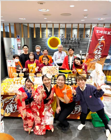
チーズ饅頭祭を盛り上げてくれた皆さんと📷

お客様からは「地元のチーズ饅頭がある！」、「チーズ饅頭を初めて食べたがとても美味しい！」との声も寄せられ、チーズ饅頭の魅力を再確認する機会となりました。