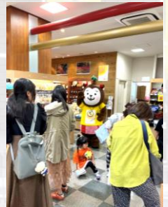
むうちゃんの来店🐕

これらのイベントを通じて、宮崎ならではの魅力を多くの方に届ける絶好の機会となりました！