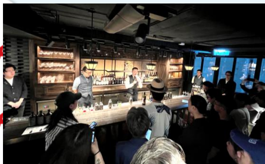
後閑氏のデモンストレーションで話を熱心に聞く、バーテンダー・現地メディア等

11月13日、香港セントラルの高級バーGOKANIにて、九州・沖縄6県合同の焼酎PRイベントを開催しました。